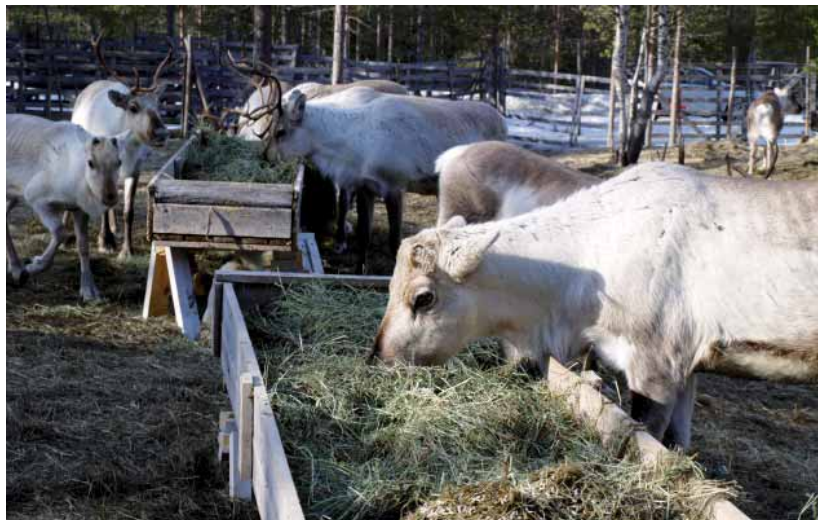
Kulottaminen vähentää loisten munia ja toukkamuotoja tarhan pohjassa.

Rehut tulee tarjota irti maasta olevista rehuastioista rehujen likaantumisen estämiseksi.