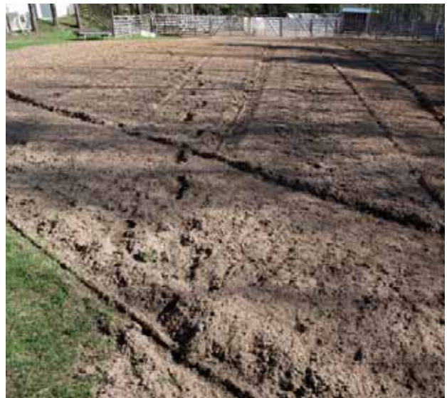
Hyvä tarhan puhdistusmenetelmä on pohjan rikkinen jyrsimällä.