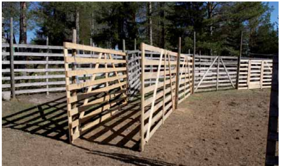
Tukevia kujia pitkin porojen siirtäminen karsinoista toiseen tai esim. kuljetusautoon on helppoa.