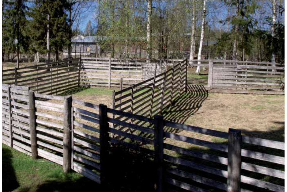
Hyvin suunnitellussa ja rakennetussa tarhassa on totutuskarsina uusille poroille ja karsina erityistä hoitoa tarvitseville sairaille tai muuten heikkokuntoisille poroille.

Tarhassa pitäisi olla vähintään totutuskarsina sinne tuotaville uusille poroille. Totutuskarsinassa porot voidaan totuttaa uusiin rehuihin sekä tarkkailla niitä mahdollisten tautien varalta. Suositeltava ”karanteeniaika” uusille, etenkin kauempaa vieropalkunnista tuoduille poroille on vähintään 2 viikkoa. Totutuskarsina tulisi sijoittaa siten, etteivät uudet porot ole kosketuksissa (aidan läpikään) tarhassa